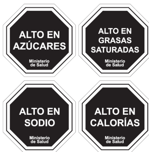
Diagrama N° 1

Las características gráficas de los descriptores nutricionales señalados en el Diagrama N°1 serán las siguientes: