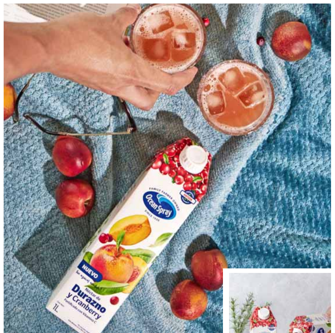
Los Súper Néctares de Ocean Spray están certificados por el INTA y combinan cranberry con durazno, piña o manzana.

Esta bebida invita a consumirla ya sea para saciar diariamente la sed, sobre todo en días de altas temperaturas para mantenerse bien hidratado con un producto funcional, o para acompañar las cenas de Navidad y Año Nuevo. Celebraciones de fin de año para las que Ocean Spray difunde varias recetas de cocina a través de su página web www.oceanspray.cl con la finalidad de enseñar a los chilenos a usar su mix de productos, desde salsas, galletas, cupcakes, hasta muy buenos cocteles. Otra forma de conseguir recetas innovadoras para cada ocasión es seguir sus